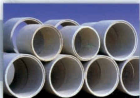
Area di stoccaggio